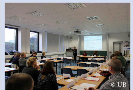
Jahrestreffen der NRW-Archive

Wie können digitale Daten dauerhaft erhalten werden (Langzeitarchivierung)? Welche Aufbewahrungsfristen gelten für Unterlagen, die an Hochschulen entstehen? Welche Erfahrungen wurden bislang mit der Einführung von Dokumentenmanagementsystemen gemacht? Welche Erfahrungen gibt es bei der Verwendung von alterungsbeständigem Papier in Uni-Verwaltungen? Diese und andere Fragen standen auf der Tagesordnung beim Jahrestreffen der Hochschularchive NRW am 17.02.2016. Rund 40 HochschularchivarInnen aus ganz NRW sowie Gäste aus Niedersachsen folgten der Einladung des Universitätsarchivs Duisburg-Essen.