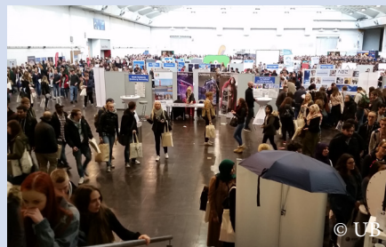
Markt der Möglichkeiten

Am 12.10.15 waren die UB und das ZIM erneut beim Markt der Möglichkeiten vertreten. Die rund 4000 Studierenden, die in die Halle 11 der Messe Essen kamen, konnten sich über die Dienste und Angebote der vertretenen Einrichtungen informieren.