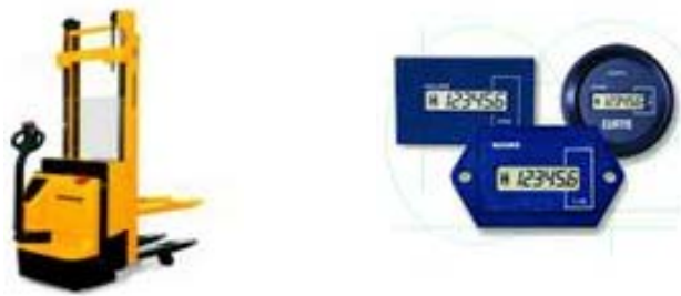
Abbildung 1 und 2

The institute of Transportation systems and -logistics, University of Duisburg-Essen deals at present with a research-project in the area of Intralogistics. Our research concerns with the following topic "Use of Industrial Trucks". The goal of our investigation is to describe and demonstrate a systematical evaluation of the use-time (hour meter) of the industrial trucks. The measurement way of the hour meter has a high importance, as it has a big influence on the calculation of the lifetime and therewith on the calculation of costs with rent -, leasing and also maintenance contracts. In addition, the use-time is also used as a calculation-basis for the dimensioning from fleets to the overcoming of logistical transportation tasks. The measurement of the use-time of an industrial truck can be calculated in different ways – depending on manufacturers or contract forms. This document illustrates the results of a questionnaire about the measurement of the use-time. For further information and the presentation of the results please visit our web page http://www.uni-duisburg-essen.de/tul/