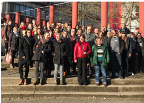
Konnten sich bei einer Auftaktveranstaltung kennenlernen: alte und neue ABZ-Mitarbeiter/innen.

► https://www.uni-due.de/abz/semesterprogramm