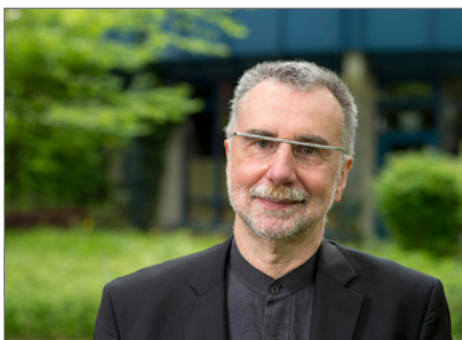
Verfasser der Studie: Dr. Jochen Hippler. © INEF

► https://www.uni-due.de/de/presse/meldung.php?id=9733