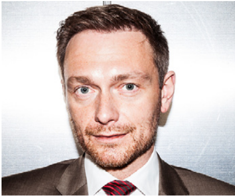
Zu Gast: Christian Lindner.