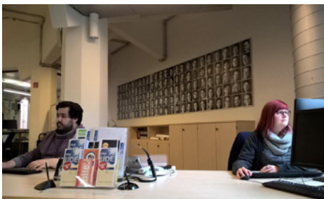
Die Portraitfotos schmücken jetzt die Wand.