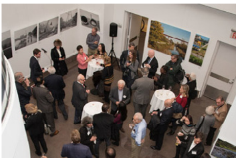
Ein Blick auf die Gäste der Ausstellungseröffnung im German House, N.Y.

► https://www.uni-due.de/de/presse/meldung.php?id=9732