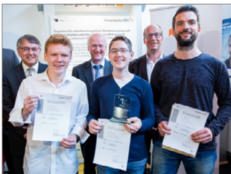
Belegten den ersten Platz: Schüler des Don-Bosco-Gymnasiums aus Essen mit ihrem Lehrer. © Schuchrat Kurbanov

► https://www.uni-due.de/in-east/news.php?id=134