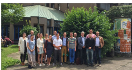
Sahen sich in Essen um: Angehende Geschichtslehrer/innen aus Gouda.

► http://www.energieagentur.nrw/brennstoffzelle/11._wettbewerb_fuelcellbox_2016