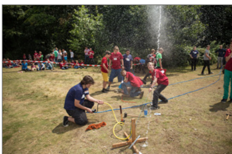
Eine Wasserrakete in Aktion.

► https://www.uni-due.de/de/presse/meldung.php?id=9449