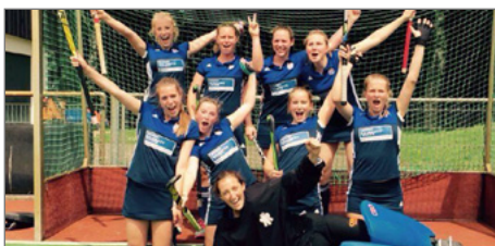
Siegreich: Das Feldhockey-Team.