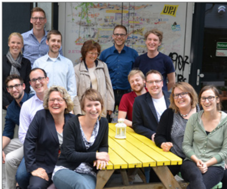
Gruppenbild mit Ministerin: Svenja Schulze (vorne links) zu Besuch bei den Kollegiat/innen.