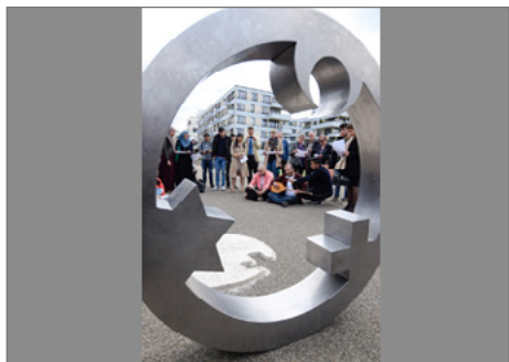
Der Engel der Kulturen auf dem Essener Campus.