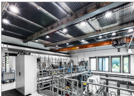
Blick auf die obere Etage der Nanopartikelsyntheseanlage.

► https://www.uni-due.de/de/presse/meldung.php?id=9340