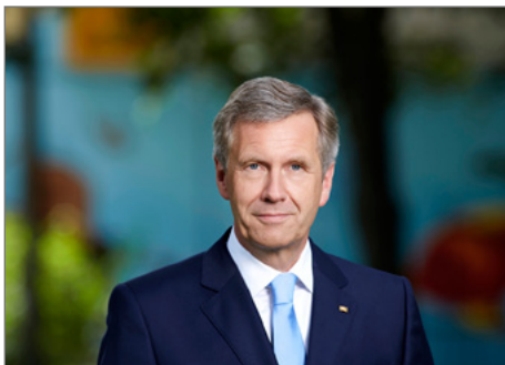
Bundespräsident a.D. Christian Wulff.

► https://www.uni-due.de/de/mercatorprofessur/