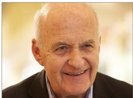
Götz W. Werner.