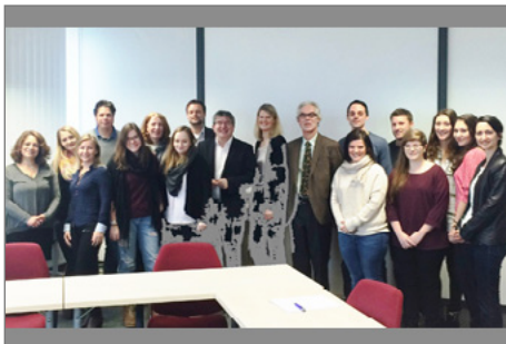
Die Projektteilnehmenden

► https://www.uni-due.de/de/presse/meldung.php?id=9206