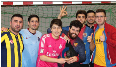
© Das Siegerteam Adanademirspor. © ISV

► https://www.uni-due.de/inkur/neuerscheinungen.php