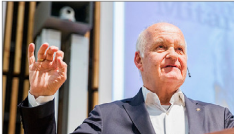
Götz W. Werner.