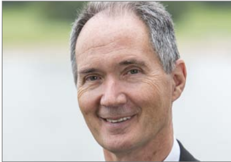
Spricht zum Auftakt des Uni-Collegs: Rektor Prof. Ulrich Radtke.