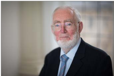
Der Ökonom Sir Tony Atkinson ist Redner bei der 15. Käte Hamburger Lecture.

► https://www.uni-due.de/de/uni-colleg/2015-2016_radtke.php