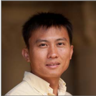
Scientist in Residence Prof. Yi Cui.

sern Lithium-Ionen-Batterien in Elektro-Autos. Wie die passgenauen Spezialisten künftig noch nachhaltiger entwickelt werden können, erforscht Professor Yi Cui an der Stanford Universität. Er ist in diesem Semester „Scientist in Residence“ an der UDE und hält am 25. November einen öffentlichen Vortrag zum Thema „The Energiewende – how Nanomaterials can help“.