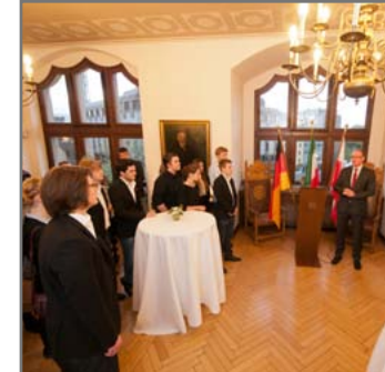
Empfang die Studierenden: Duisburgs OB Sören Link (r.).