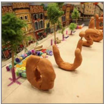
Das Modell „Der Goldene Spaten“.

► http://www.uni-due.de/de/presse/meldung.php?id=7674