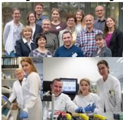
Ukrainische Labormitarbeitende aus Poltawa/Ukraine