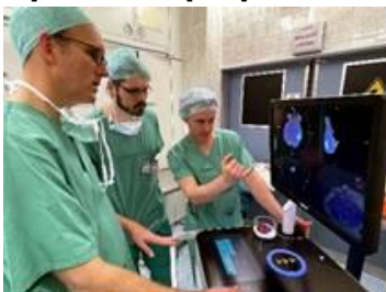
XEOS AURA 10 PET-CT ® für Gewebeproben